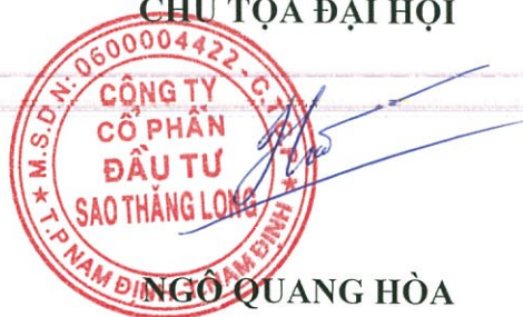
NGÔ QUANG HÒA